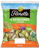
ENSALADA CUATRO ESTACIONES