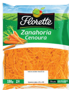
ZANAHORIA RALLADA FLORETTE