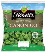
ENSALADA CANÓNIGOS GOURMET