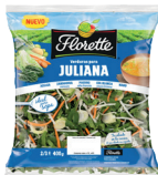
VERDURAS PARA JULIANA