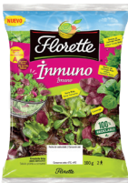
ENSALADA INMUNO FLORETTE