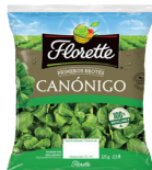
PRIMEROS BROTES CANÓNIGO