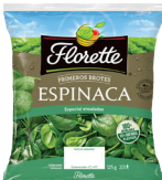
ENSALADA ESPINACA PRIMEROS BROTES