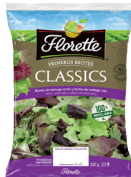
ENSALADA PRIMEROS BROTES CLASSICS