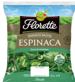
ENSALADA ESPINACA PRIMEROS BROTES